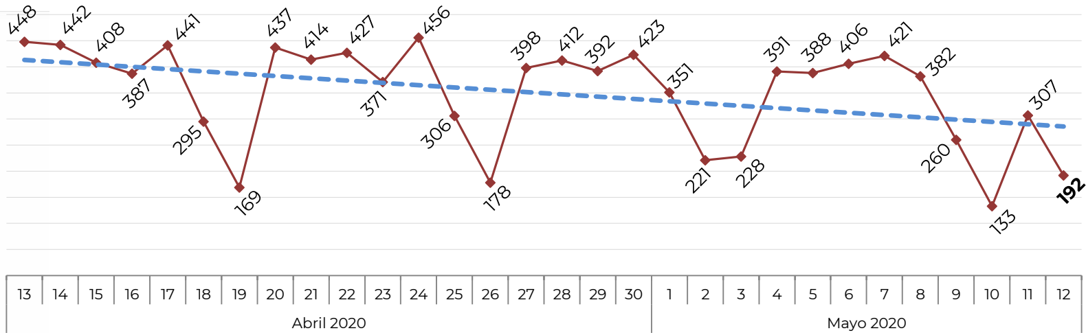
No. de Vehículos Robados (últimos 30 días)