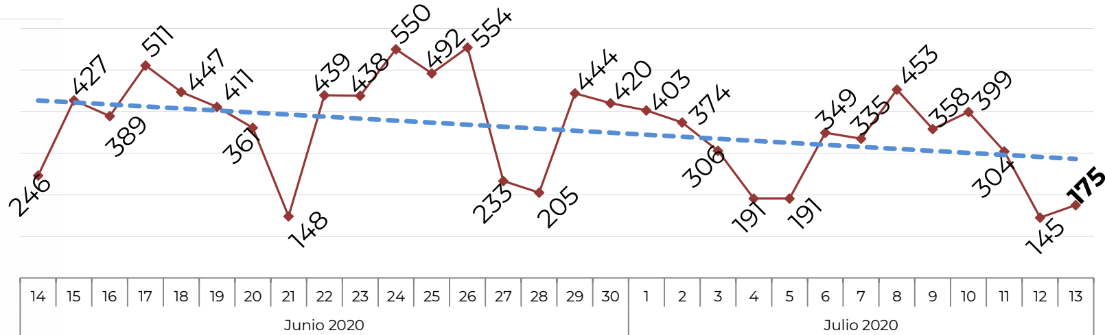
No. de Vehículos Robados (últimos 30 días)